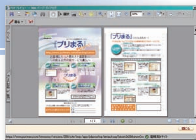
印刷結果もブラウザ上ですぐに確認！

※ 1 お住まいの地域や印刷物の種類、部数によって、若干遅れる可能性があります。 ※ 2 17 時以降の注文の受付は、翌日扱いとなります。