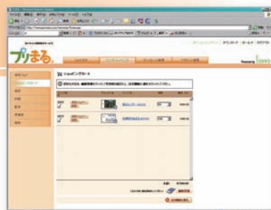
注文時、見積価格も表示されるので安心！

プリまるは、発注された時点で印刷用 PDF を自動で作成。 それをそのまま印刷することで、制作コストを削減し、 低価格で安定したサービスを提供できます。 加えて、ご注文時には見積価格も表示されるので安心です。