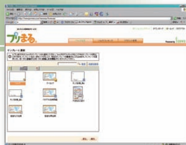
基本は画面をクリックしていただく！

発注作業は、画面に従って入力&クリックしていただく。 オンラインショッピングを経験したことがあるなら、 違和感なく操作することが可能です。 もちろん、初めての人でもカンタンに使えます。